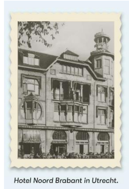
Hotel Noord Brabant in Utrecht.

Daar wordt besloten “gezamenlijk een Vereeniging op te richten ter bevordering van den handel in motorvoertuigen, onderdelen of toebehoren daarvan en garagehouders”. Die avond wordt BOVAG, de Bond van Automobielhandelaren en Garagehouders, geboren.